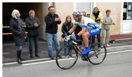
spectateurs et coureurs avaient le sourire