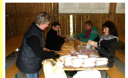
ces dames en plein préparatif

Quelques clichés du prix cycliste qui s'est déroulé le 18 septembre.