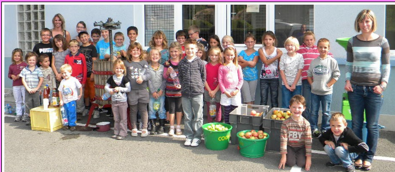
Activité de saison : Confection de jus de pomme. Les 2 classes ont broyé, pressé pour en tirer le délicieux jus.