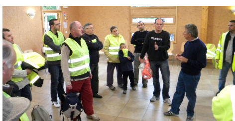
le briefing des signaleurs

Nous tenons tout particulièrement à remercier et féliciter les associations du village qui avaient en charge l'organisation des buffets et des buvettes (l'ASL, les petits écoliers, le club de football et les chasseurs). Un grand merci aussi aux signaleurs, placés tout au long du circuit et aux 3 motards accompagnant les pelotons pour garantir la sécurité de la course. Toutes ces personnes ont bravé le froid, la pluie avec le sourire pendant 5 heures pour assurer une compétition de qualité. Le club organisateur envisage une compétition de grande envergure pour l'année prochaine ! Le parcours très sélectif, le site, les infrastructures et l'organisation en générale, leur ont beaucoup plu. Nous en reparlerons.